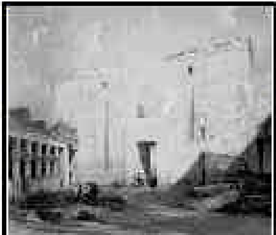
Die Ruinen von Ujak